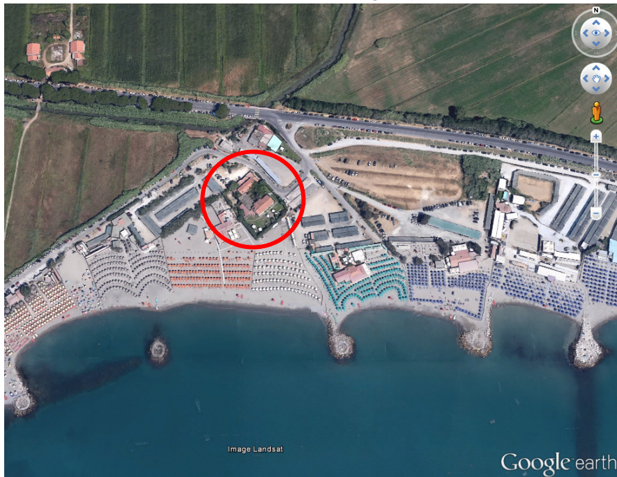
estratto foto aerea

la società "GAG s.r.l." è proprietaria dell'immobile ad uso locanda e ristorante denominato "Le Tamerici" sito in Via Litoranea n°106, loc. Fiumaretta, Ameglia (SP).